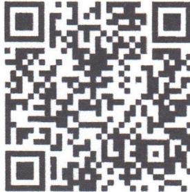
E-Learning กรมการปกครอง