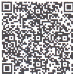
แบบตอบรับการเข้าร่วมโครงการฝึกอบรม หลักสูตรสืบสวนสอบสวนพนักงานฝ่าย ปกครอง ประจำปีงบประมาณ พ.ศ. ๒๕๖๔