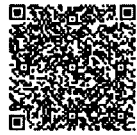
ช่องทางการจัดส่งเอกสารฯ

๔) จัดส่งรายชื่อผู้สมควรได้รับการเสนอขอพระราชทานเหรียญพิทักษ์เสรีชน พร้อมหนังสือ นำส่ง และเอกสารประกอบการเสนอขอพระราชทานเหรียญพิทักษ์เสรีชน ครั้งที่ ๑ ประจำปี พ.ศ. ๒๕๖๘ ให้สำนักงานเลขาธิการกรม กรมการปกครอง ภายในวันพุธที่ ๒๗ พฤศจิกายน ๒๕๖๗ ผ่านช่องทาง Google Forms ตาม QR Code “ช่องทางจัดส่งเอกสาร” ในรูปแบบไฟล์ PDF สำหรับหนังสือฉบับจริง ขอให้ สำนัก/กอง และที่ทำการปกครองจังหวัด เก็บรักษาไว้ที่หน่วยงานต้นสังกัดเพื่อใช้เป็นหลักฐานในกรณีที่มีความจำเป็นต้องตรวจสอบ