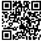
ระบบการเสนอขอพระราชทานฯ

๓) มอบหมายเจ้าหน้าที่ผู้รับผิดชอบ ดำเนินการยื่นคำขอให้บุคลากรในสังกัดผ่านระบบการเสนอขอพระราชทานเหรียญพิทักษ์เสรีชน ปค. ได้ที่ http://mis4.dopa.go.th/0301/decoration วันจันทร์ที่ ๒๘ ตุลาคม ๒๕๖๗ - วันศุกร์ที่ ๒๒ พฤศจิกายน ๒๕๖๗ พร้อมรวบรวมเอกสารประกอบการเสนอขอพระราชทานฯ ทั้งนี้ สำหรับชื่อผู้ใช้งาน (Username) และรหัสผ่าน (Password) เป็นชื่อผู้ใช้งานเดียวกันกับการเสนอขอพระราชทานเครื่องราชอิสริยาภรณ์และเหรียญจักรพรรดิมาลา ประจำปี พ.ศ. ๒๕๖๗